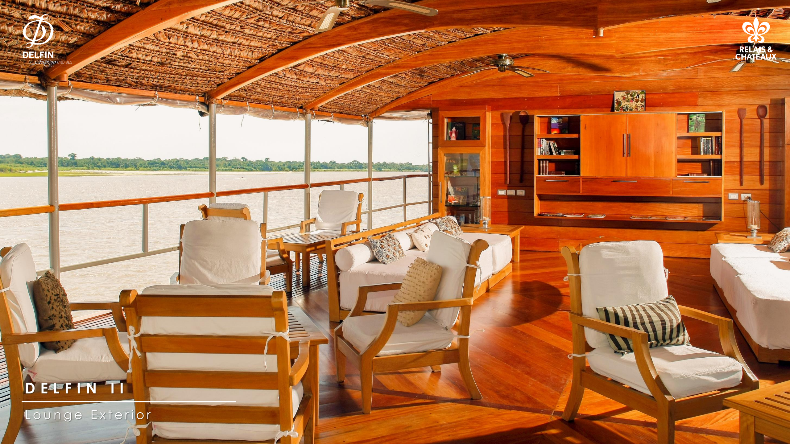
DELFIN TI Lounge Exterior