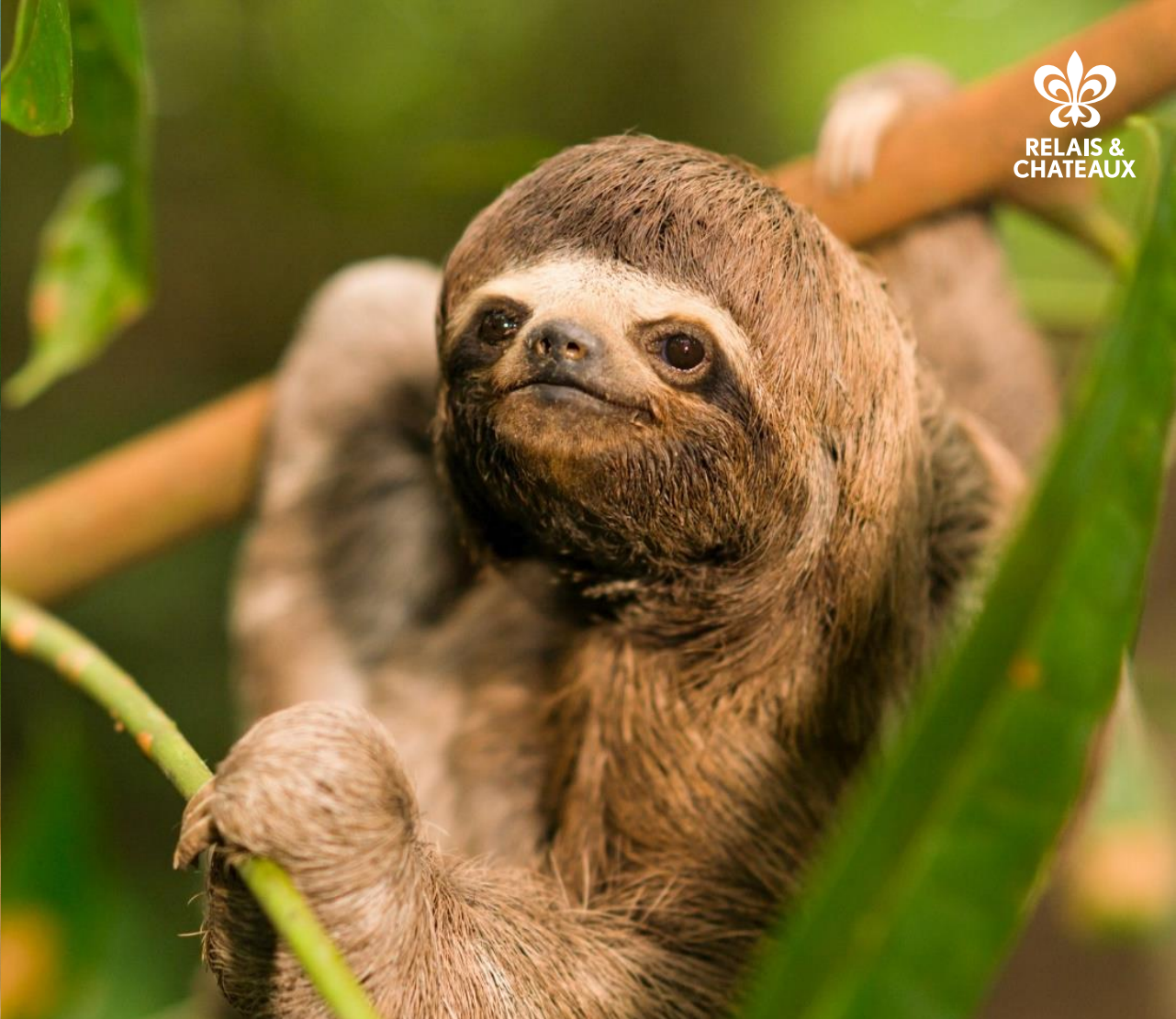
Oso Perezoso de tres dedos