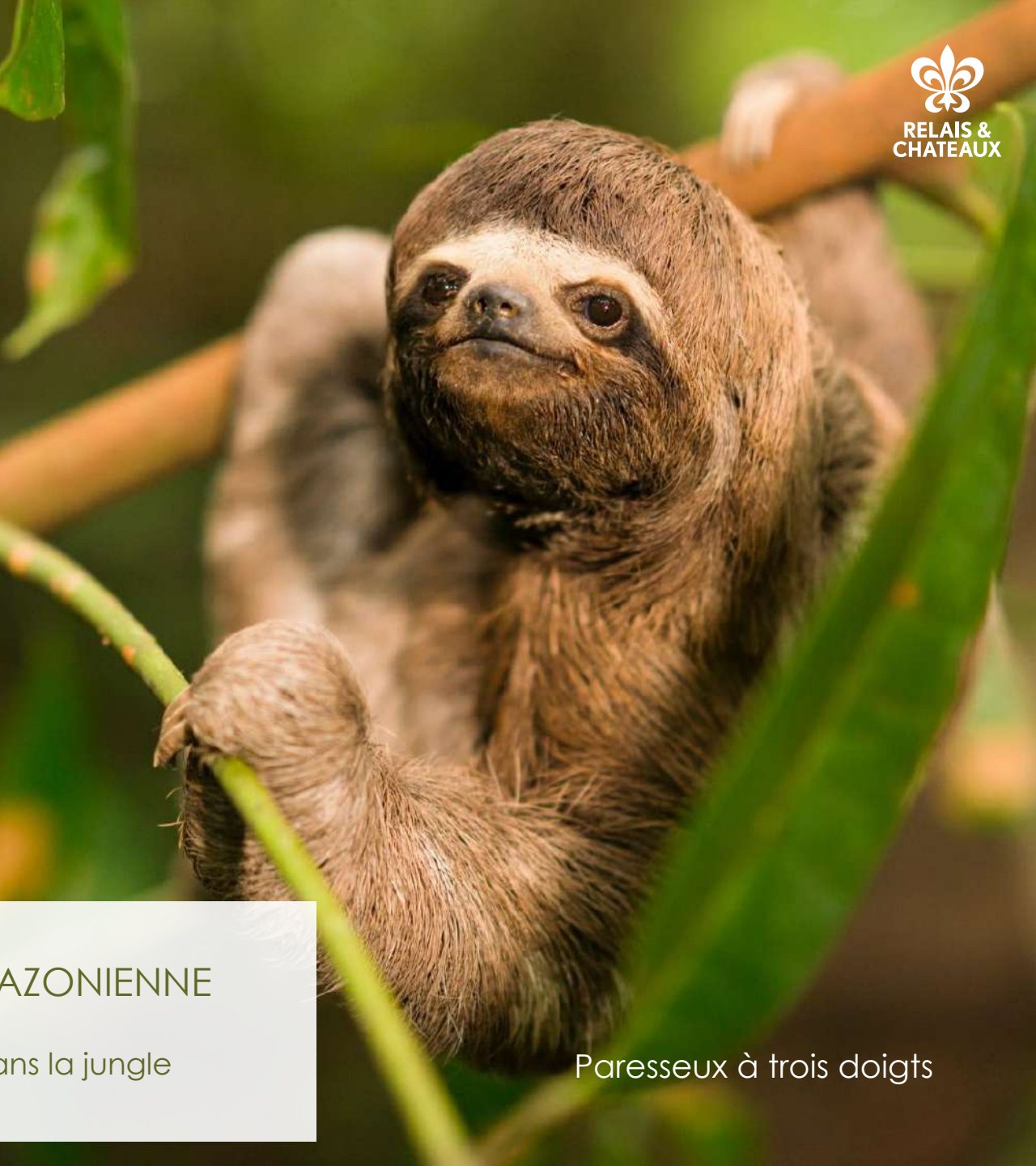
Paresseux à trois doigts